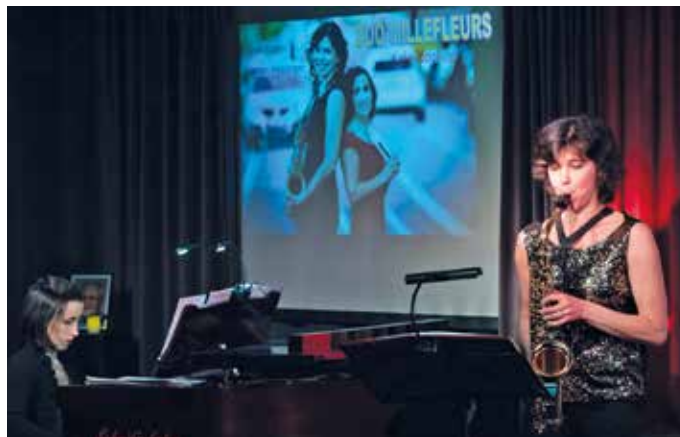
Das „Duo Millefleur“ in Schmid's Laden.

Schmid's Laden: Kirchstr. 4, 84144 Geisenhausen (direkt im Ortskern bei der Pfarrkirche St. Martin)