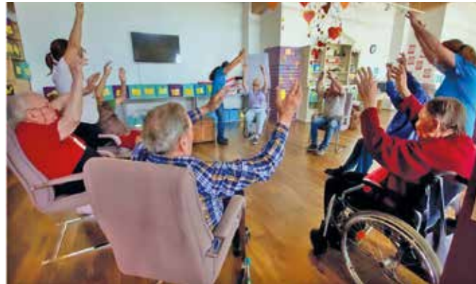
Vivissimo hat sich auf Tagespflege spezialisiert. Mit Öffnungszeiten von 8:00 bis 18:00 Uhr schaffen wir von Montag bis Freitag Freiraum für Angehörige und Spaß für unsere Gäste.

Viele Senioren bl u hen in der Vivissimo-Gemeinschaft und bei regelm a Bigem Essen auf. Alte Freundschaften werden wiederbelebt, neue Freundschaften entstehen.