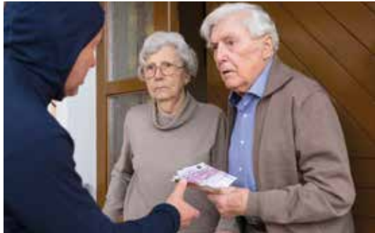
Die Kripo Landshut informiert in einem Vortrag zum Thema Enkeltrick

Die nächste Seniorenberatung für Senioren und Angehörige findet am 04.04.2023 und 02.05.2023 im Bürgerhaus Zimmer 106 von 14:00 bis 15:00 Uhr statt. Hier wird eine kostenlose Beratung angeboten.