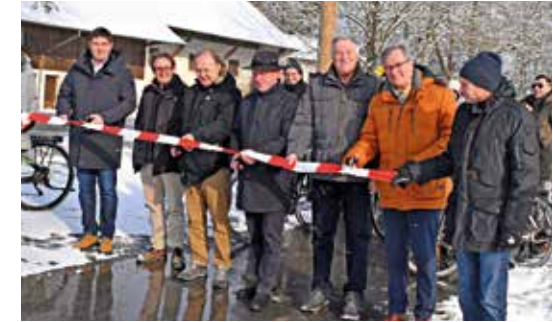
Mit dem Durchtrennen des symbolischen Sperrbandes durch den Bürgermeister, seine Stellvertreter und Mitarbeiter der Planungsfirmen wurde der Radweg nach Diemanskirchen offiziell in Dienst gestellt.