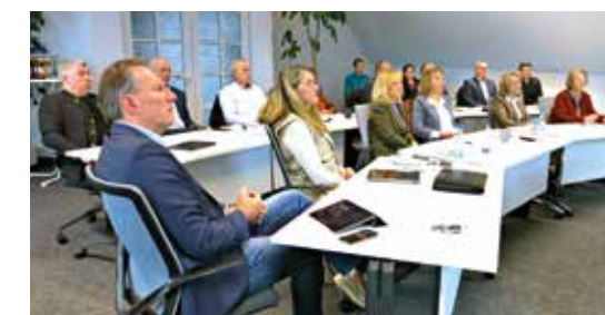
Beteiligtenversammlung in Gerzen

Die ILE Bina-Vils Radtour durch alle 14 Gemeinden wurde vorgestellt. Zu finden ist sie demnächst über die App komoot.