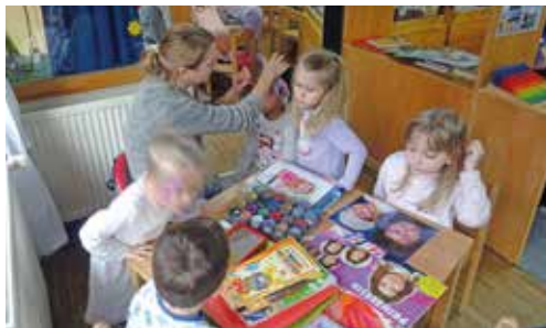
Schminken in der Sternengruppe