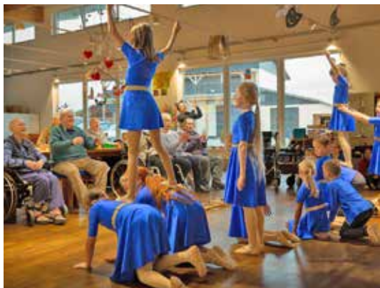
Einsamkeit oder Überforderung im Alltag sind kein Thema mehr. Die Vivissimo Mitarbeiter fördern die vorhandenen Kompetenzen und helfen, wo Unterstützung nötig ist

Zum Abschluss gibt es ein Abendessen, dann geht's zur internen Bushaltestelle, und die Fahrer bringen unsere G aste wohlversorgt nach Hause, wo die Angehorigen ihre Lieben in Empfang nehmen.