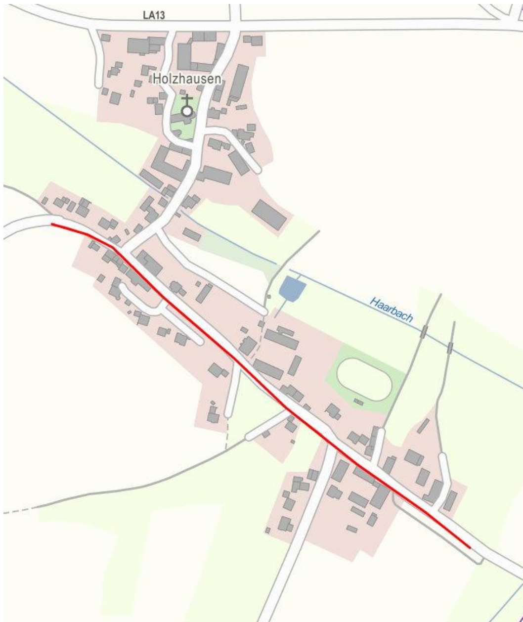
Lageplanskizze Leerrohr 3: Rote Linie